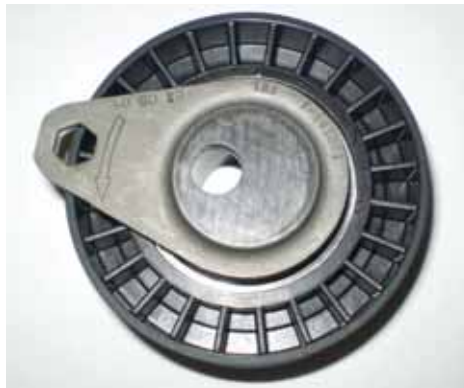
Рис. 2 Новая система зажима